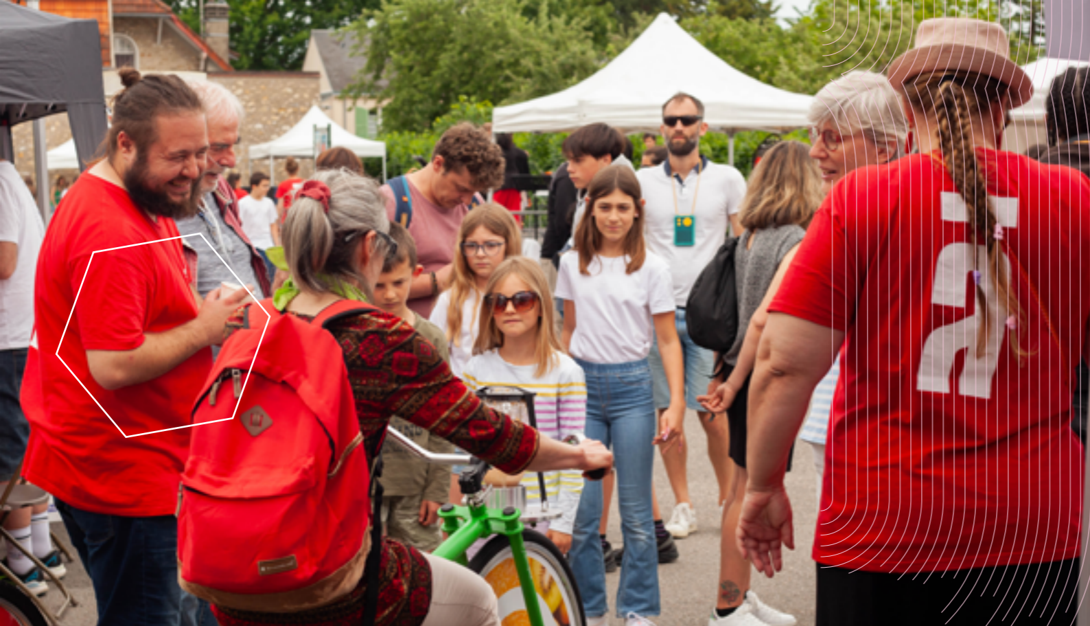
Fête de l'Usine à Chapeaux