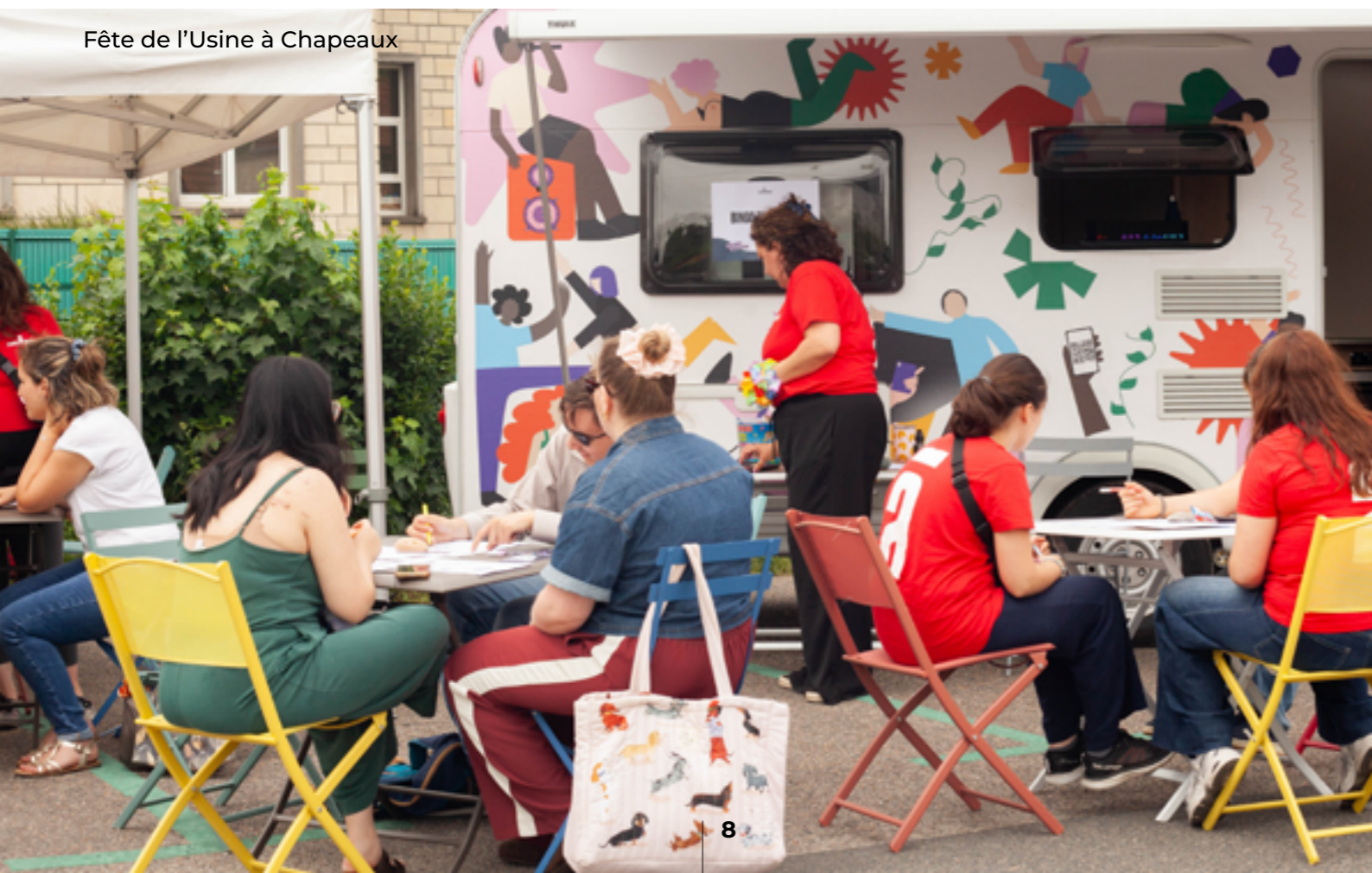
Fête de l'Usine à Chapeaux