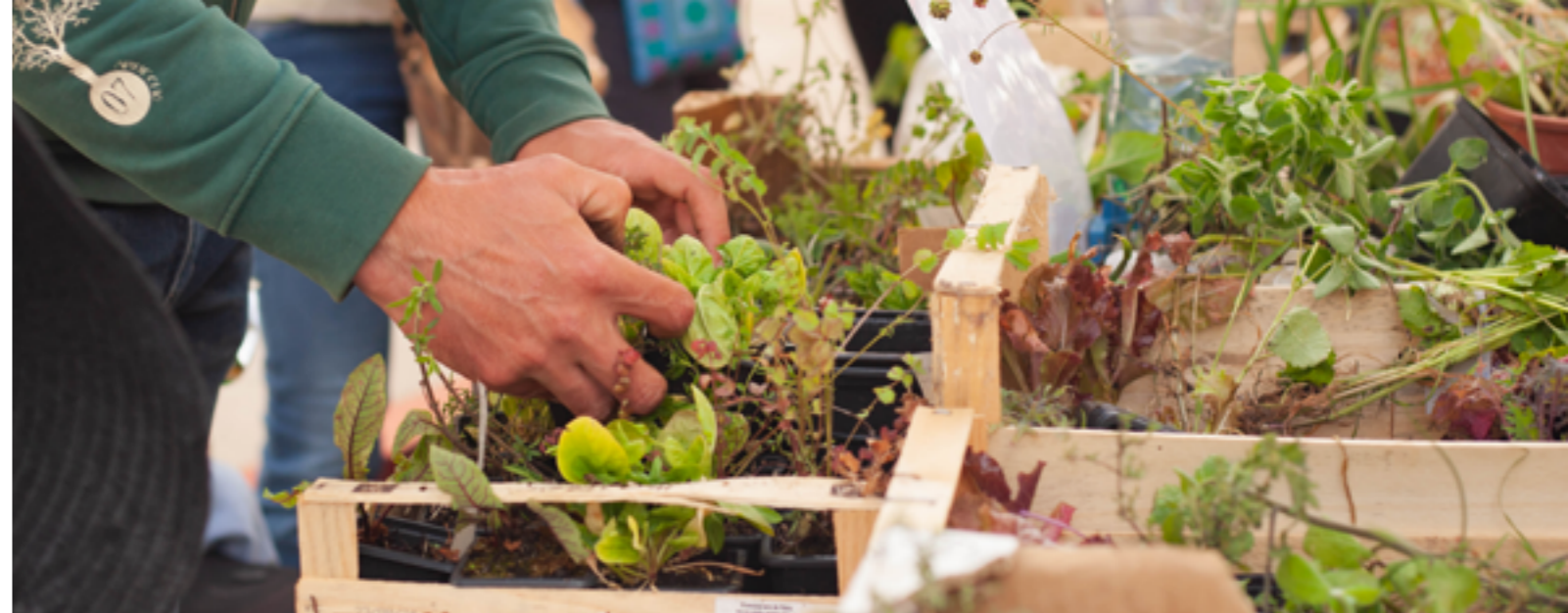
Bourse aux plantes

Départ de Clément Praud de la direction générale en juillet 2025 et lancement d'une procédure de recrutement pour son remplacement